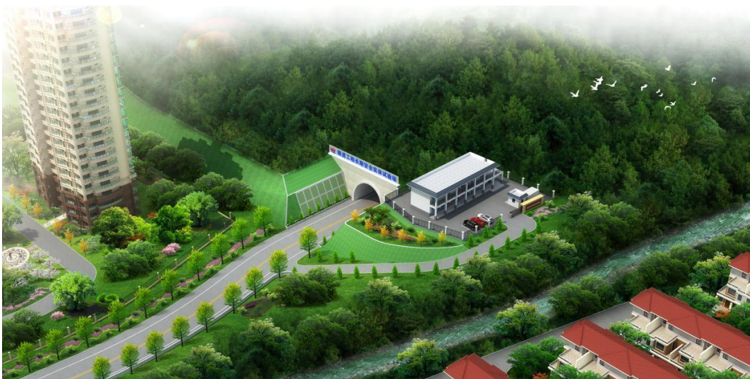
试验场建成后洞口环境