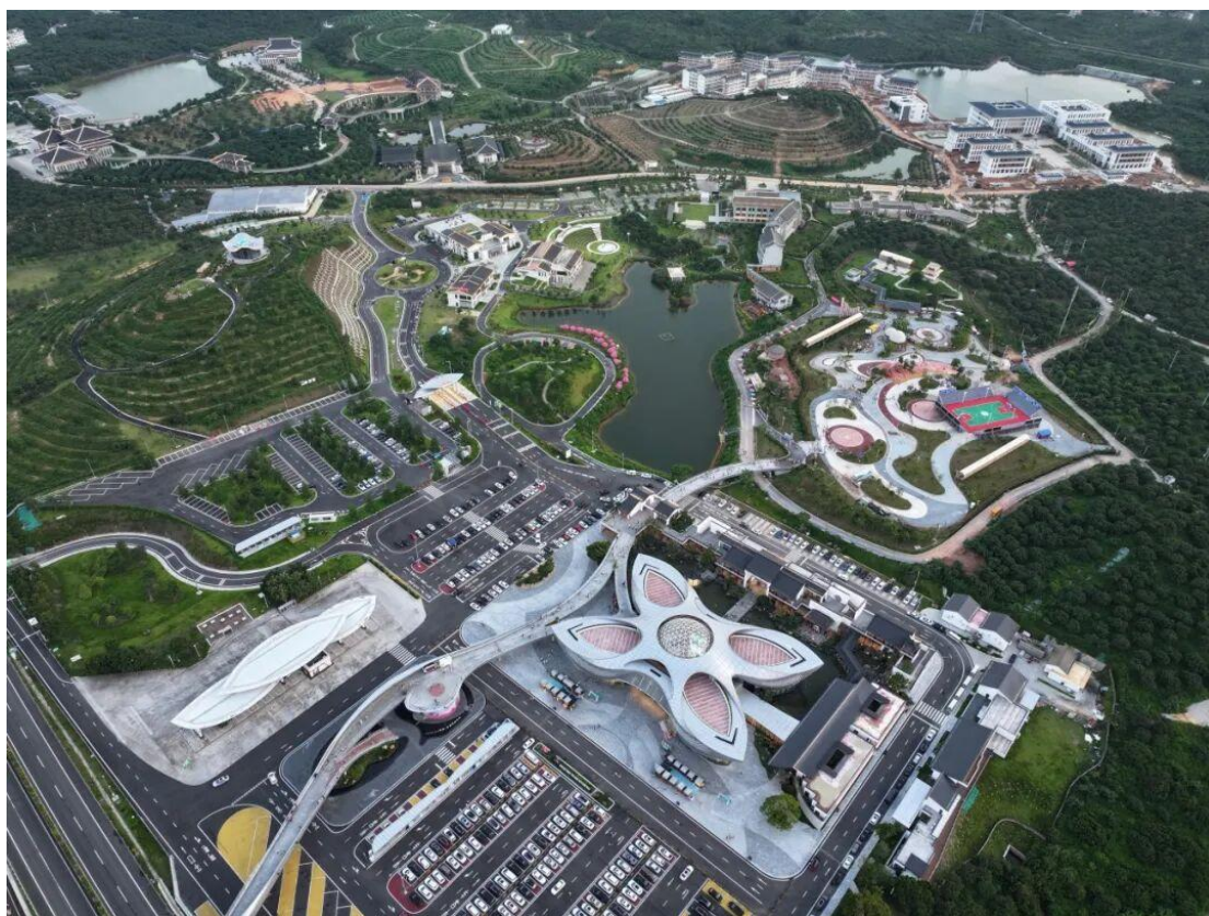
2025 年 5 月 20 日，包茂高速柏桥服务区提质升级完工投入运营，是广东首个荔枝文化开放式特色服务区。

发现风险总数 1.1 万处并实现闭环整治；在全国率先编制公路边坡、桥梁、隧道结构等技术指南，并推进干线公路结构监测预警系统建设；扎实开展工程设计回溯与质量回溯，从源头提升基础设施安全水平；严格落实交通运输部“三十条”硬措施，扎实有序开展安全生产治本攻坚三年行动、2025“省隐患排查治理年”、10 年以上客车安全隐患排查整治“回头看”、“船撞桥”风险再整治等各类整治工作，不断夯实交通运输安全发展根基。