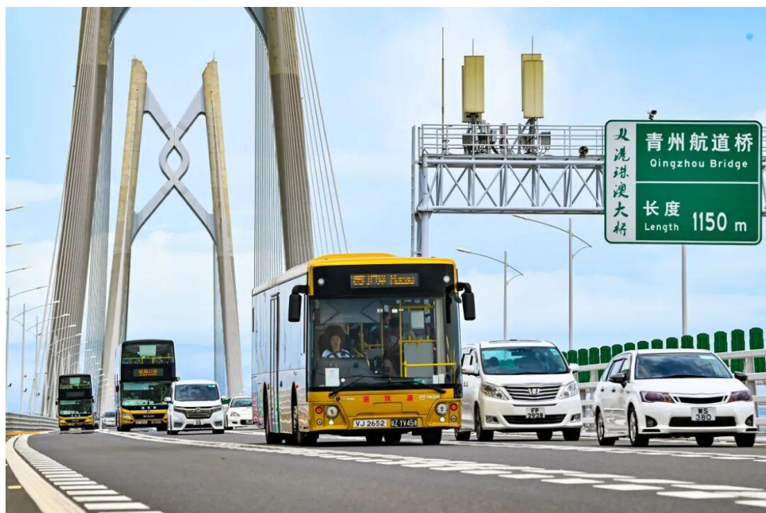
2025 年 11 月，“粤车南下”香港口岸停车场政策和粤车进入香港市区政策顺利实施。

“十四五”期，沿海主要港口集装箱铁水联运量年均增长超 25%，铁路、水路货运量占比提升至 31.4%，运输结构持续优化。