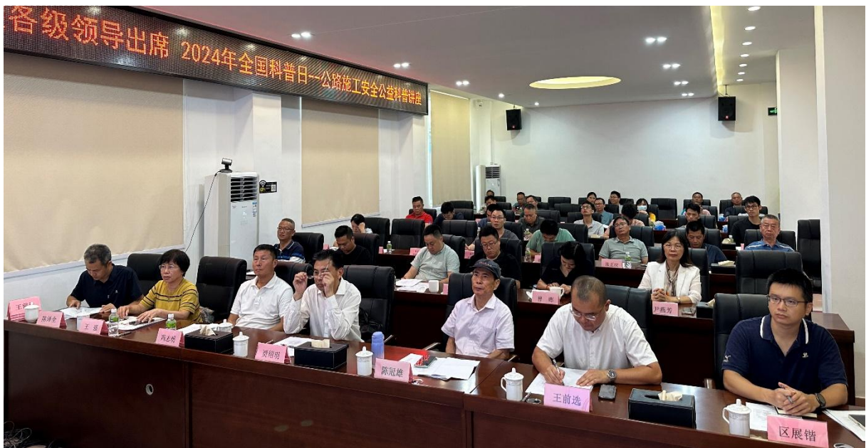
“安全人人抓,幸福千万家”科普讲座现场

此次活动,由广东省公路学会主办,江门市交通建设行业协会承办,采取线上线下相结合的形式进行。广东省交通运输厅副厅长贾绍明、广东省公路学会专家委员会主任陈冠雄、江门市交通运输局副局长王前选、江门市公路事务中心总工程师区展锴参加活动并致辞。江门市路桥投资发展有限公司董事长冯志明先生致欢迎词。