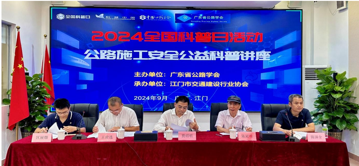
“安全人人抓,幸福千万家”科普讲座现场

广东省公路学会积极响应中国公路学会《关于举办 2024 年全国科普日公路知识普及宣传活动的通知》(公学字〔2024〕92号)文件精神,于2024年9月20日在江门组织开展了以“安全人人抓,幸福千万家”为主题的公路施工安全公益科普讲座。