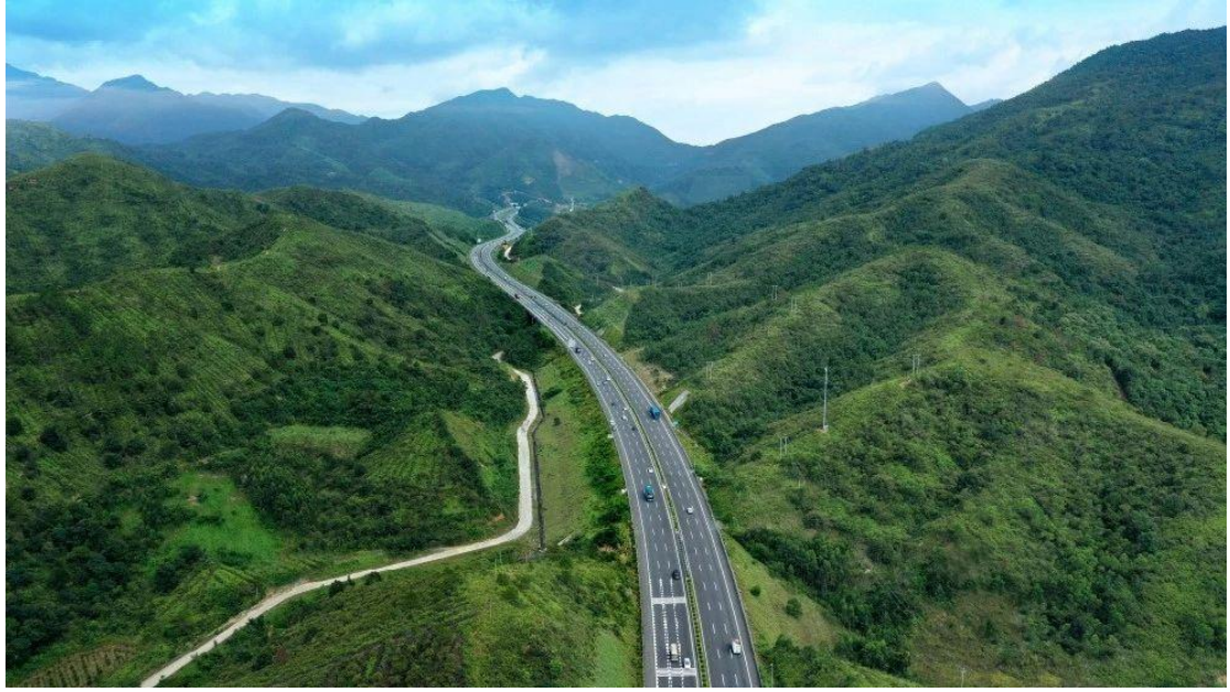
广东省潮州至惠州高速公路